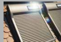
Dachfensterrollladen WERSO, mit Solarantrieb

Die Langlebigkeit ist unbestreitbar das wichtigste Qualitätskriterium für ein Garagentor. ROMA setzt auch hier auf den Werkstoff Aluminium. Einerseits rostet Aluminium nicht und bietet Witterungsbeständigkeit, andererseits passt die filigrane Toroptik zu jedem Haustyp.