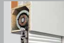
Für Sanierung von Fenster und Rollladen: TERMO.F